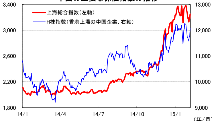
(ポイント) 中国の主要な株価指数の推移 (ポイント)

(注)データは2014年1月1日～2015年2月5日(最終日は前場の始値)。 (出所)Bloomberg L.P.のデータを基に三井住友アセットマネジメント作成